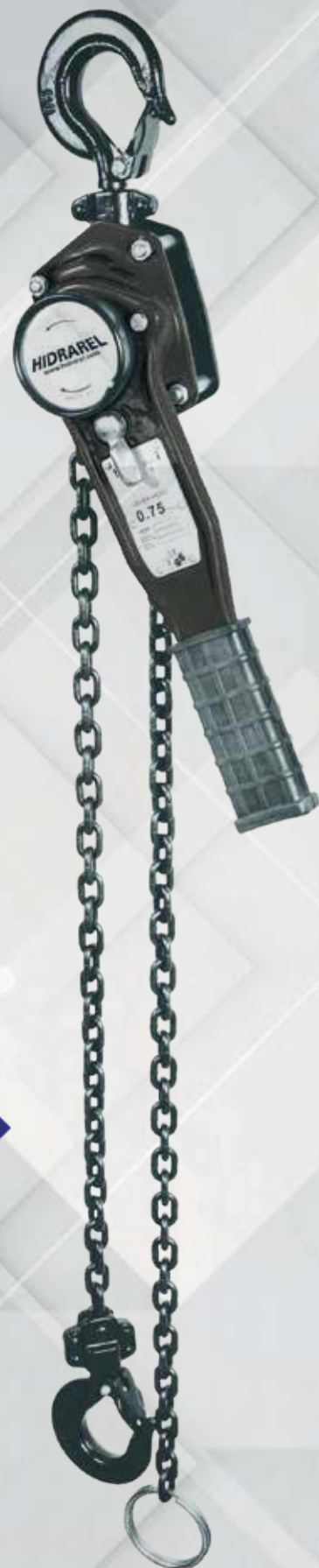
TABLA DE MEDIDAS